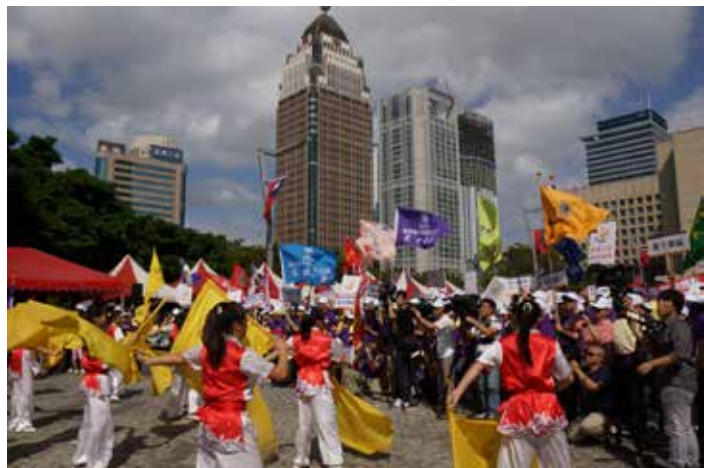
戲曲學校耍大旗表演

宣誓後，九千多人的遊行隊伍在台北市交通大隊重機組引導下邁入仁愛路林蔭大道上，獅友們也配合環保主題，大家以最安靜的方式來表達我們訴求，有別於其他喧鬧遊行活動，此特殊景象，因此引來了路過行人、等公車民眾的注目。當隊伍走到光復南路口，遇到兩位來台自助旅行之外籍學生，