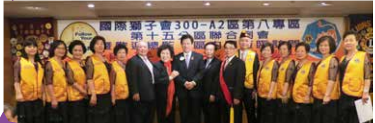
李總監與新獅友合影