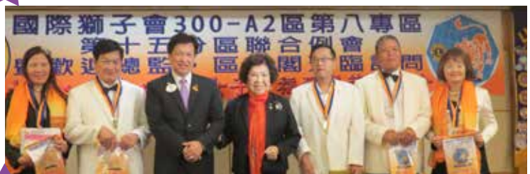
總監致贈總監章(旗)與福爾摩薩獅友合影