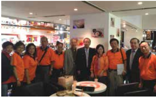
奈良西獅子會50周年紀念前夕特別到大阪和我們討論細節