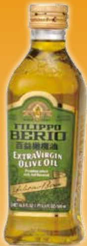
100%特級 橄欖油 500 ml