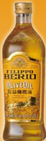
100%特選 純橄欖油 1000 ml