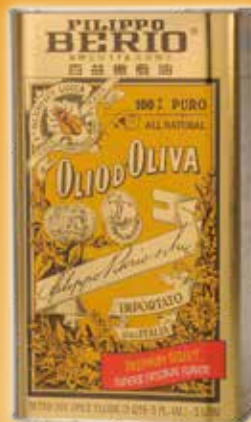
100%特選 純橄欖油 3000 ml