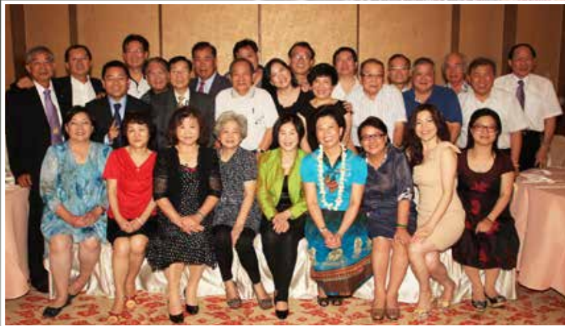
文/前會長 郭義彥(大稻埕) 圖/財務 黃振義(大稻埕)

成立於1969年4月19日的大稻埕獅子會，歷經風雨未被擊倒，與其說是奇蹟，不如說是堅持信念者的勝利。