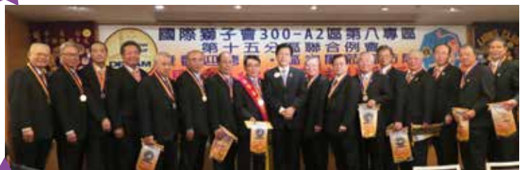
總監致贈總監章(旗)與大同獅友合影