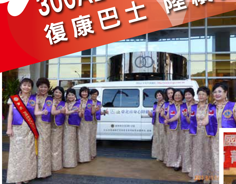
台北市菁英獅子會捐贈復康巴士

今年有八個分會要捐復康巴士，第一個帶頭響應的是菁英獅子會，第二是菁彩獅子會，第三是老松獅子會，第四是大同、大同女獅子會，第五是東南獅子會，第六是西區獅子會，第七是北區獅子會。