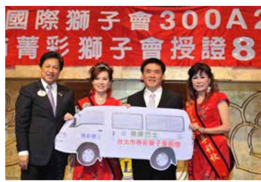
台北市菁彩獅子會捐贈復康巴士 由郝市長代表接受！