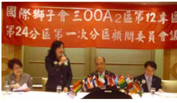
秘書長黃秀榕的鼓勵