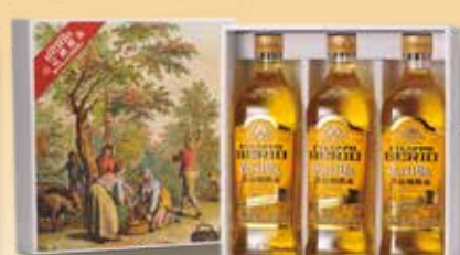
純橄欖油禮盒(3入裝)