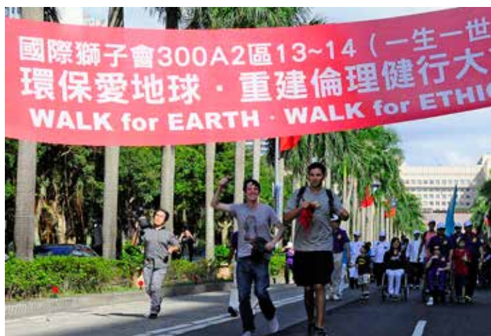
支持獅友環保愛地球重建倫理道德遊行而臨時加入之來台自由行外籍學生