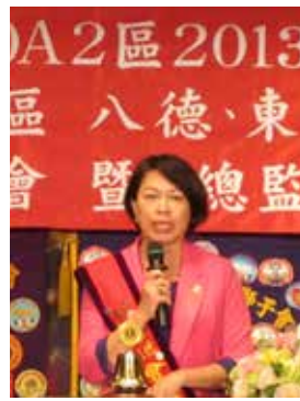
八德林語姍會長報告