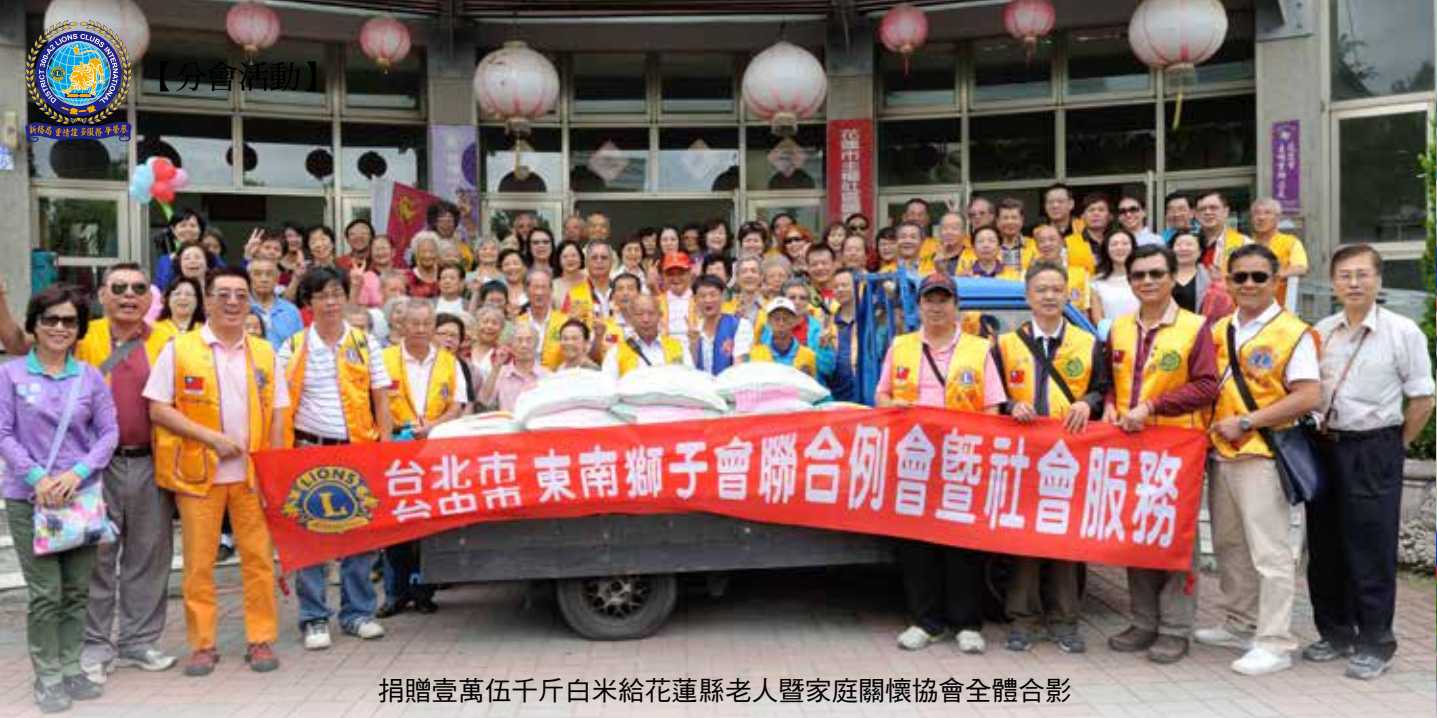
捐贈壹萬伍千斤白米給花蓮縣老人暨家庭關懷協會全體合影