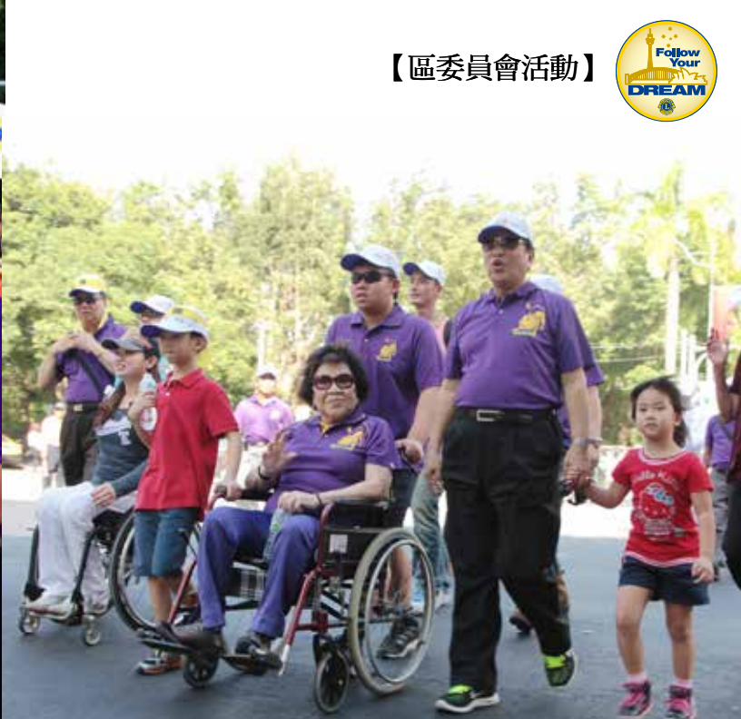
總監一家人正是獅友重視倫理道德最佳代言人

在各種場合鼓勵獅友參加外，在上媒體時，更是把握機會讓『環保愛地球，重建倫理道德』健行大會對外曝光，也因他們盡心、用力的宣傳，引起廣大的迴響；除了300A2區獅友攜帶眷屬參加外更號召了近九千人參與活動；對外，因活動主題明確、切合當今社會關注之事務，而獲得台北市政府高度重視，並榮蒙市長正式行文同意擔任此次大會活動之指導單位；由於文創長努力下獲經濟部工業局電動車辦公室提供活動獎勵金二十萬元、又運用公關長才向光陽公司募得價值十五萬之電動機車兩部；另外，簡又新、立委、議員、教育局長林奕華、社會局將局長、社會團體、機關學校、重視環保及倫理道德的名人諸如：台北市盲人福利協進會、慈濟慈善基金會、新住民協會、艾馨公益慈善基金會、國立台灣戲曲學院、崇義高中、明道國小、樟樹國小、苗栗翔飛獅鼓隊、路跑協會紀政理事長、影視名人黃維德、張瓊玲、邱