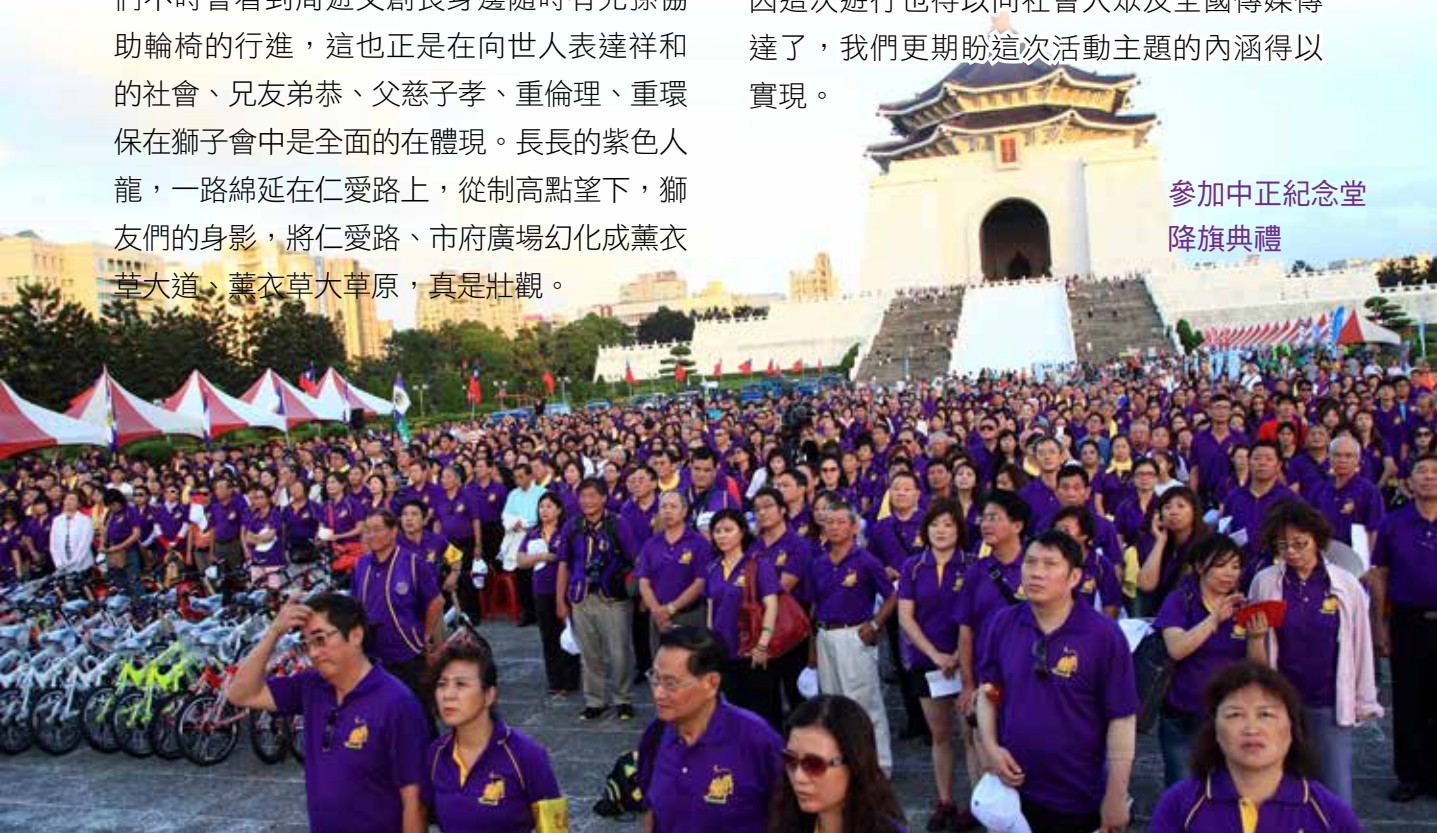
參加中正紀念堂 降旗典禮

這是一場集合公益、創意、健心健身、正能量傳遞的活動，獅友們在這近五公里的路程中，一路向社會傳遞我們重視子孫們的生活品質，我們期盼中華固有倫理道德能受重視並重建，我們希望人心應淨化以讓社會更祥和；同時在這次活動中，獅子會的社會公益服務新形象被強化了；國際獅子會300A2區團隊「我們服務」的行動和理念，因這次遊行也得以向社會大眾及全國傳媒傳達了，我們更期盼這次活動主題的內涵得以實現。