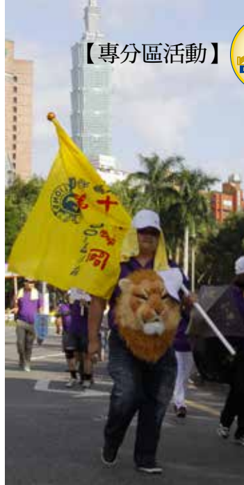
第十二專區特別準備的獅子頭