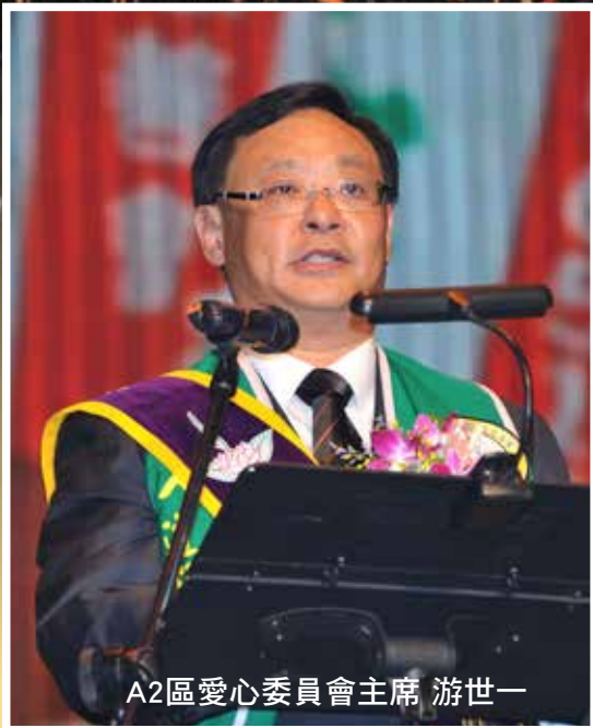
圖 / 獅誼月刊 攝影團隊