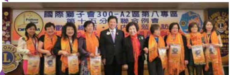
總監致贈總監章(旗)與大同女獅友合影