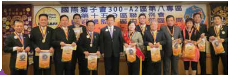
總監致贈總監章(旗)與太平獅友合影